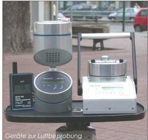
Geräte zur Luftbeprobung