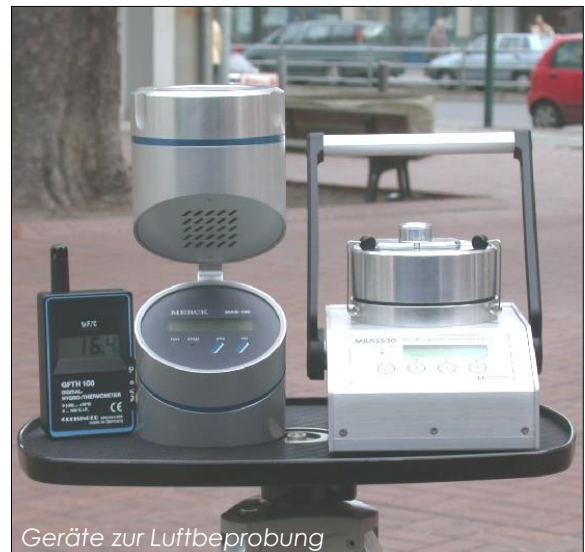
Geräte zur Luftbeprobung